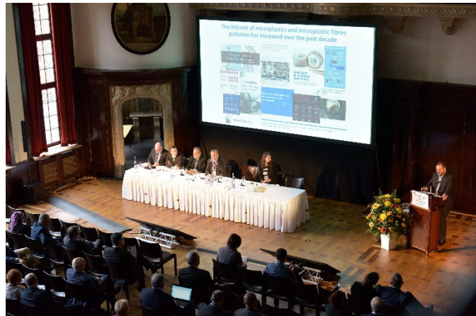
Die International Cotton Conference findet wieder in Präsenz statt, aber auch online

Bremen, den 14.06.2022: Der Startschuss für die Registrierung ist gefallen: Vom 29. bis 30. September 2022 findet die 36. International Cotton Conference Bremen statt. Organisatoren der Tagung sind das Faserinstitut Bremen e. V. und die Bremer Baumwollbörse. Die International Cotton Conference ist eine der bekanntesten internationalen Fachtagungen rund um das Thema