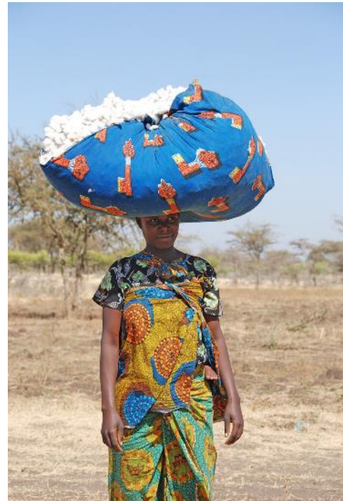
Baumwollpflückerin in Tansania

Die afrikanische Baumwolltextilindustrie ist hochgradig fragmentiert. Es fehlt an Verlinkungen zu vorgelagerten Stufen wie dem Baumwollanbau, der Entkörnung und der Vermarktung im Inland. Weniger als 20 Prozent der in Afrika produzierten Baumwolle wird auf dem Kontinent zu vermarktbareren Produkten verarbeitet, während der Rest des Rohmaterials exportiert wird. Chancen für Veränderungen werden in einem historisch zu beobachtendem Trend zur Verlagerung von Textilproduktion in weniger entwickelte Länder gesehen. Grundsätzlich wächst das Interesse internationaler Einkäufer, den Anteil der Beschaffung von nachhaltig produzierten Baumwolltextilien aus aufstrebenden Regionen zu erhöhen. Dadurch wächst die Chance auf ausländische Direktinvestitionen.