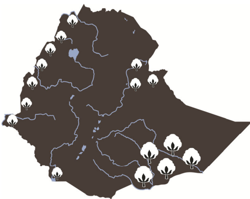
Äthiopien: Länderumriss mit Baumwollanbaugebieten

Während der Session bietet sich für Besucher der Tagung Gelegenheit, aktuelle Herausforderungen der äthiopischen Strukturentwicklung zu diskutieren. Wichtige Themen sind hier zum Beispiel Chancen und Möglichkeiten zur Steigerung der Produktqualität oder der effiziente Aufbau vertikal integrierter Wertschöpfungsketten. Ergänzend dazu stellen äthiopische Wissenschaftler aktuelle Forschungsprojekte und deren Ergebnisse im Rahmen von Posterpräsentationen vor. Die Baumwolltagung schafft somit ein hervorragendes Umfeld, Netzwerke zu knüpfen und Geschäfte mit äthiopischen Partnern anzubahnen. Die Vertreter der äthiopischen Delegation stehen für Gespräche und Interviews zur Verfügung.