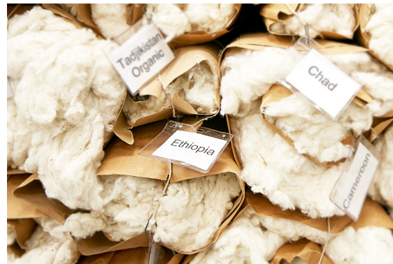
Baumwollprobe aus Äthiopien im Standardraum der Bremer Baumwollbörse

„Wir haben Äthiopien insbesondere deshalb als Gastland ausgewählt, weil es dort sowohl Baumwollproduktion wie auch eine aufstrebende Baumwollverarbeitung gibt“, sagt Axel Drieling vom Faserinstitut Bremen. „Das Land befindet sich gerade in einem spannenden wirtschaftlichen Transformationsprozess, in dem die Baumwolle eine große Rolle spielen